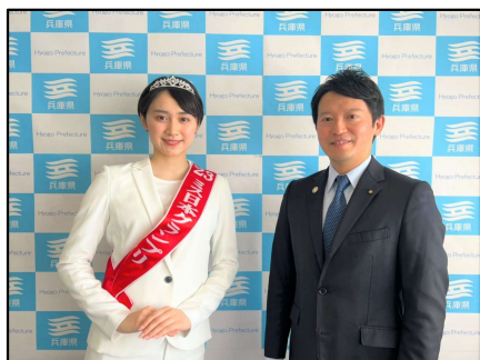
GP吉岡の地元 齋藤元彦 兵庫県知事