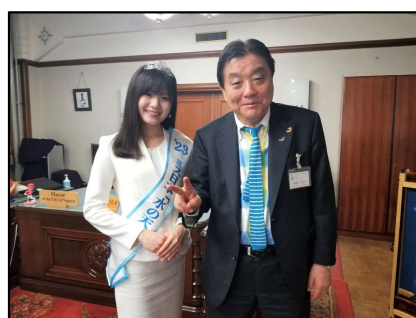
水竹田の地元 河村たかし 名古屋市長