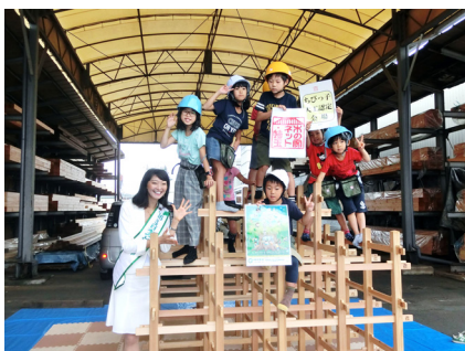
6日 木とのふれあいまつりに16飯塚、同じく26日には藤本。