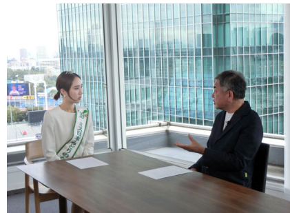
15日 CLT晴海プロジェクトについて、建築家の隈研吾さんにインタビュー