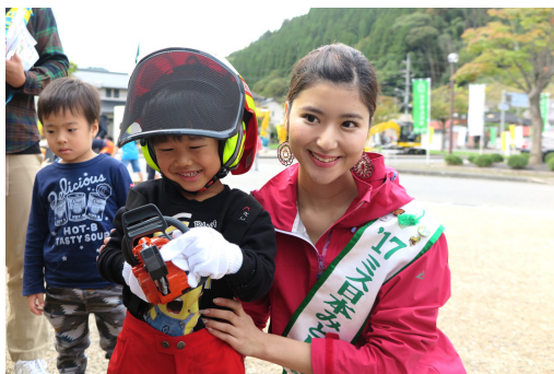
20日 日南町林業まつりに17野中