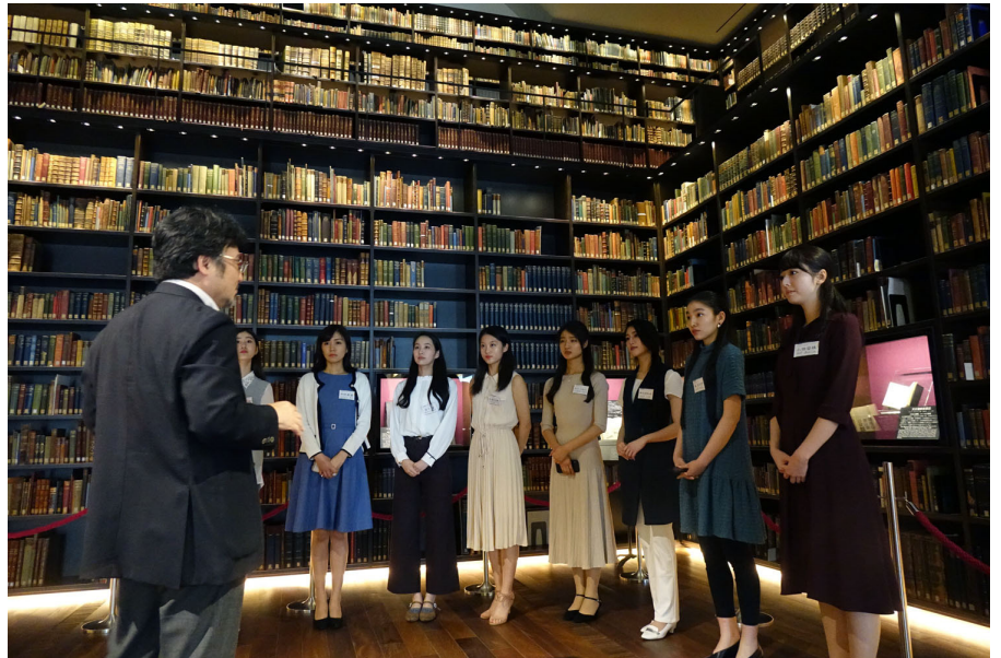
東洋文庫ミュージアムの見学。東洋学の叢智が詰まった研究図書館は、地元の人からも愛される本当に素敵な空間です。