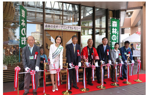
27日 水都おおさか森林の市に藤本