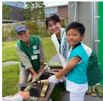
6日 高槻市都市緑化フェアに18竹川