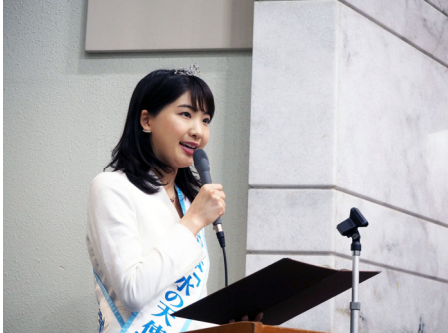
9月10日は「下水道の日」です！循環社会に寄与する取り組みを重ねた企業、団体の表彰式が国交省で行われ、西尾が司会を務めました。