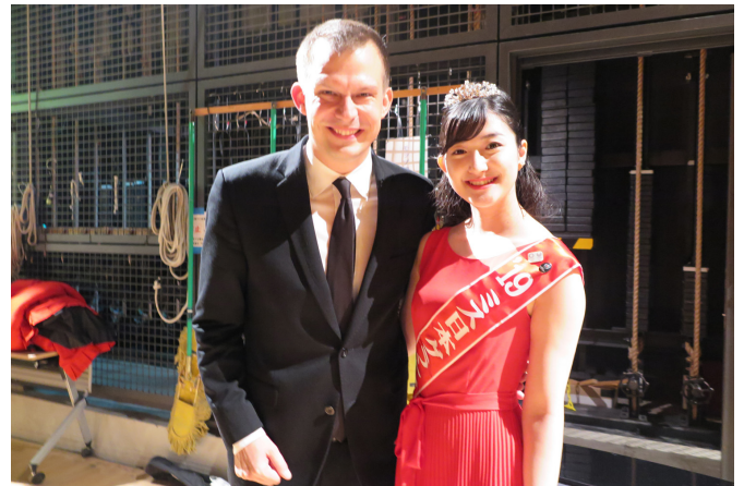
9/23 ハンガリーと日本の友好を記念したピアノコンサート。世界的なピアニストのアダムジョージさんと。