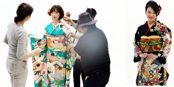
9/17,18 第1回ミス日本コンテストから協賛を継続してくださっているブライダルスタイリスト SOGAのカタログ撮影。2日で40着以上も着用！