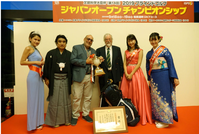
9/19 ブラインドゴルフのジャパンオープンには世界中から視覚障害ゴルファーが参加。ガイドと2名一組でハイスコアを狙います。優勝者をミス日本が祝福しました。